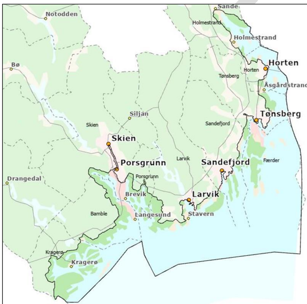
Figur 1: Foreløpig avgrensning av kystsoneplanen

I sjø foreslås det at planområdet utvides i forhold til tidligere plan og planprogram. Begrunnelsen for forslaget er en lovendring i plan- og bygningsloven i 2008 der virkeområdet i sjø ble utvidet i forhold til tidligere lov (fra 1985). Lovendringen fra 2008 gir kommunene adgang til å planlegge en nautisk mil utenfor grunnlinjen, mot tidligere lov fra 1985 som var begrenset til grunnlinjen.